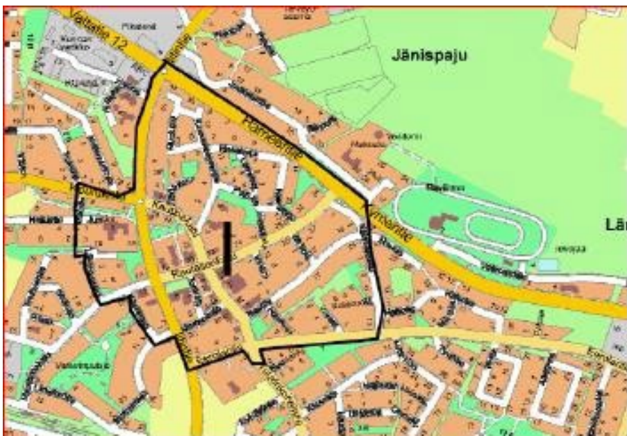
Katulupamaksukartta: Maksuluokka 1

Luvanhakijan toimittaman liikennejärjestelysuunnitelman tarkastaminen sisältyy luvan hintaan. Jos suunnitelmassa on huomattavia puutteita, hakijan on toimitettava korjattu suunnitelma hakemuksen liitteeksi.