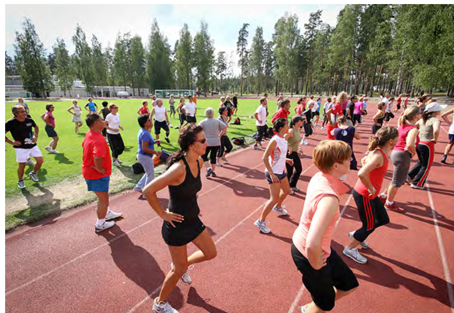
Liikuntatapahtuma Vierumäellä.

tarjoavat valtakunnalliset liikunnan koulutuskeskukset Pajulahden Urheiluopisto Lahdessa ja Suomen Urheiluopisto Vierumäellä. Lisäksi Haaga-Helia ammattikorkeakoulu järjestää liikunta- ja hyvinvointialan koulutusta ja LAB ammattikorkeakoululla ja LUT-yliopistolla on vahvaa TKI-toimintaa. Yhteensä edellä mainituissa koulutusorganisaatioissa on liikuntaan ja terveyden edistämiseen liittyvää asiantuntijaosaamista noin 150 henkilötyövuotta ja opiskelijoita eri koulutusohjelmissa yli 1500.