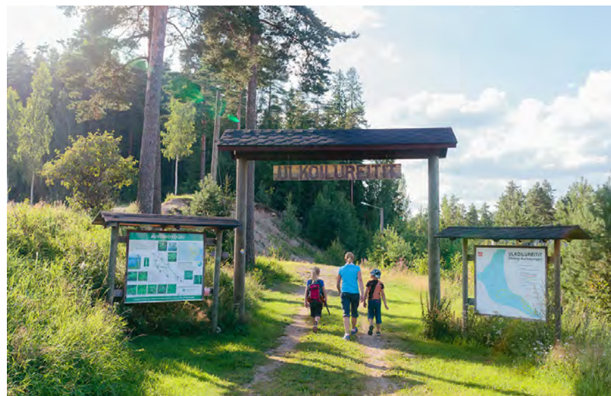
Aurinko-Ilves ulkoilureitti.

Liikunta ja liikkuminen kuuluvat suomalaisten sivistyksellisiin perusoikeuksiin, joten kaikilla ikäryhmillä on oikeus liikuntaan ja liikkumiseen. Sosiaalisen kestävyys ja tasa-arvon näkökulmasta tulee kiinnittää huomiota eriarvoisuuden vähentämiseen ja yhtäläisten mahdollisuuksien tarjoamiseen. Myös tasa-arvoinen kohtelu, asenteet sekä käytännön teot ovat merkittäviä vastuullisen toiminnan elementtejä. Kokonaisvaltaisesti vastuullisen toiminnan avulla on mahdollista saavuttaa yhdenvertaisempi, suvaitsevampi, osallistavampi, turvallisempi ja kestävämpi liikuntakulttuuri.