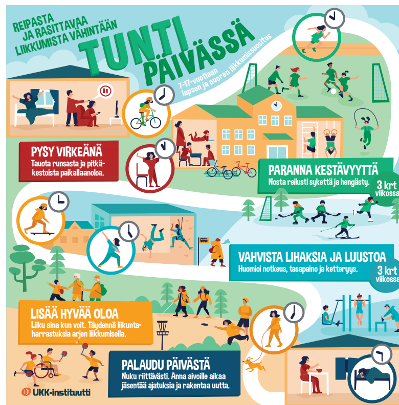
Kuva: Lasten ja nuorten liikkumisen suosituksen keskeiset viestit.

Kaikille 7–17-vuotiaille suositellaan monipuolista, reipasta ja rasittavaa liikuntaa vähintään 60 minuuttia päivässä yksilöllä sopivalla tavalla, ikä huomioiden. Runsasta ja pitkäkestoista paikallaanoloa tulee välttää.