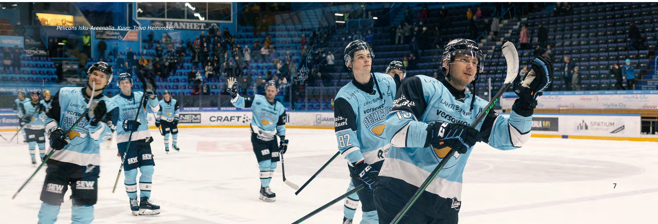
Pelicans Isku-Areenalla.

Huippu-urheilu on yhteiskuntaan erottamattomasti kuuluva osa, joka tuottaa iloa ja hyötyä niin yhteiskunnalle kuin yksilöillekin. Urheilu yhdistää ja inspiroi suomalaisia ja arvostamme urheilumenestystä. Urheilun esikuvat innostavat monia liikkumaan ja urheilutapahtumat ovat monelle kunnalle tärkeä vetovoimatekijä. Edellytysten luominen tapahtumille sekä ammattilaisten alueellisen yhteistyön hyödyntäminen ovat keskeisiä tapoja edistää urheilua paikallistasolla. Urheilijoilla tulee olla kansainvälisesti kilpailukykyiset valmentautumis- ja toimintaympäristöt, sillä jokainen huippu-urheilu-ura lähtee kasvuun paikallisista edellytyksistä. Urheilun ja koulunkäynnin yhdistämistä helpottavat ratkaisut ovat tärkeä tuki tavoitteellisesti urheileville nuorille. Tämän mahdollistavana alustana toimivat urheiluakatemit, jotka ovat alueellisia oppilaitosten, seurojen sekä asiantuntijaorganisaatioiden verkostoja.