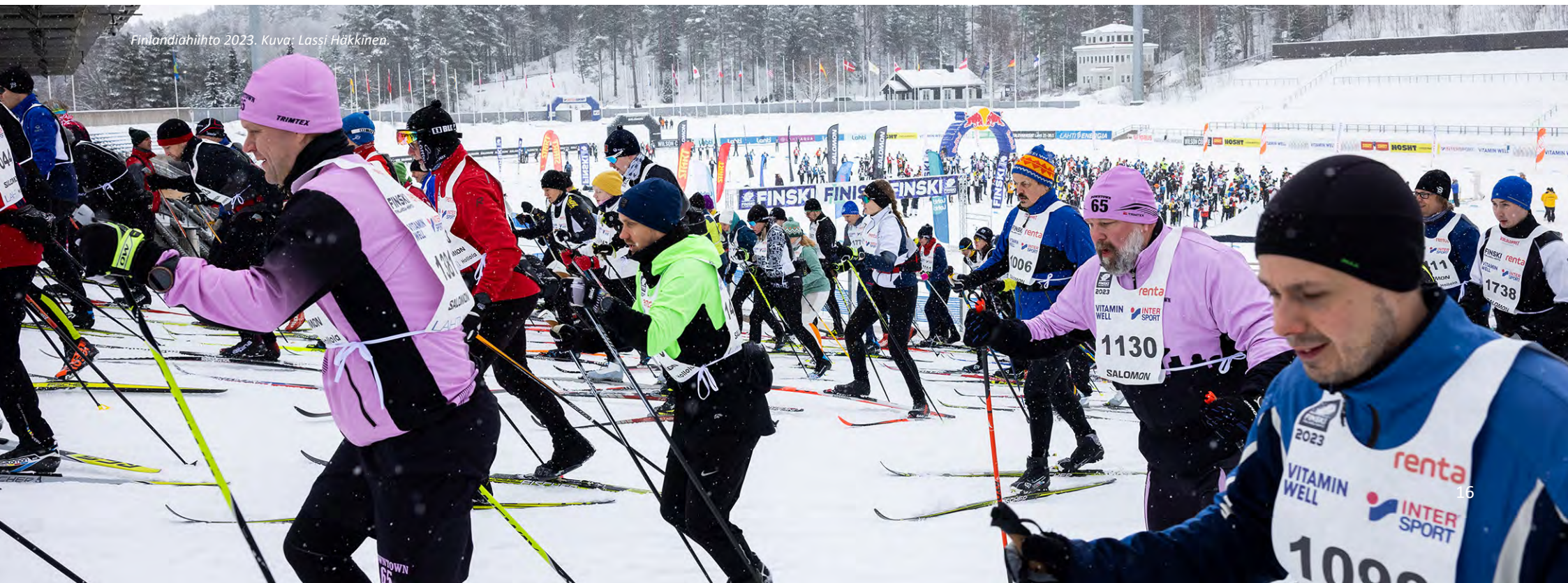
Finlandiahihto 2023.

jotka hyötyvät eniten liikunnan tuomista terveysvaikutuksista on tärkeää osallistaa mukaan kehitystyöhön. Tämä edellyttää sekä palveluiden tuottajien että sidosryhmien ajattelutavan ja toimintatapojen muutosta asiantuntijälähtöisestä kehittämisestä käyttäjälähtöisempään kehittämiseen. Palvelumuotoilun menetelmät tarjoavat tähän monipuolisia mahdollisuuksia. Eri toimialojen välisen yhteistyön ja käyttäjälähtöisen kehittämisen kautta pystytään lisäämään ymmärrystä erilaisista käyttäjistä, heidän tarpeistaan ja toiveistaan sekä tuottamaan innovatiivisia ideoita, joita toteuttamalla pystytään vaikuttamaan päijähämäläisten fyysisen aktiivisuuden lisääntymiseen ja paikallaanolon vähentämiseen.