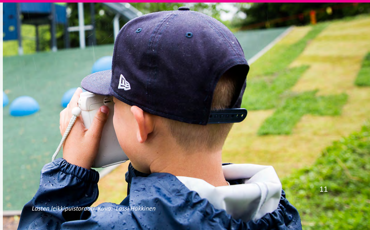
Lasten leikki puistoraafi.