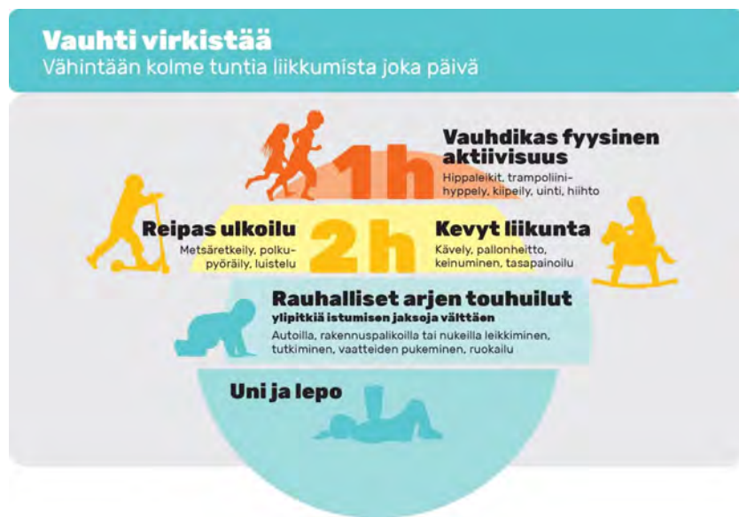
Kuva: Vauhti virkistää. Varhaisvuosien fyysisen aktiivisuuden suositukset 2016. Opetus- ja kulttuuriministeriö 2016: 21.

Alle 8-vuotiaiden lasten päivään pitäisi sisältyä vähintään kolme tuntia liikuntaa, joka koostuu kevyestä liikunnasta, reippaasta ulkoilusta sekä vauhdikkaasta fyysisestä aktiivisuudesta. Yli tunnin istumisjaksoja tulee välttää ja lyhyempiäkin paikallaanoloja tauottaa lapselle mielekkäällä tavalla. Lapselle tulee antaa mahdollisuus myös rentoutumiseen ja rauhoittumiseen.