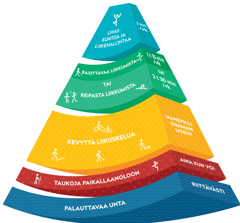
Kuva: Viikoittainen liikkumisen suositus 18–64-vuotiaille.

Viikoittainen liikkumisen suositus 18–64-vuotiaille kertoo terveyden kannalta riittävän viikoittaisen liikkumisen määrän ja antaa esimerkkejä liikkeen lisäämiseen arjessa. Suositus huomioi myös kevyen liikuskelun, paikallaanolon tauottamisen ja riittävän unen merkityksen. Sydämen sykettä kohottavaa liikettä eli reipasta liikkumista suositellaan tehtäväksi 2 tuntia 30 minuuttia viikossa. Samat terveyshyödyt saa myös lisäämällä liikkumisen tehoa rasittavaksi. Tällöin liikkumisen määrä on 1 tunti 15 minuuttia viikossa. Lihaskuntoa ja liikehallintaa tulisi harjoittaa vähintään kaksi kertaa viikossa.