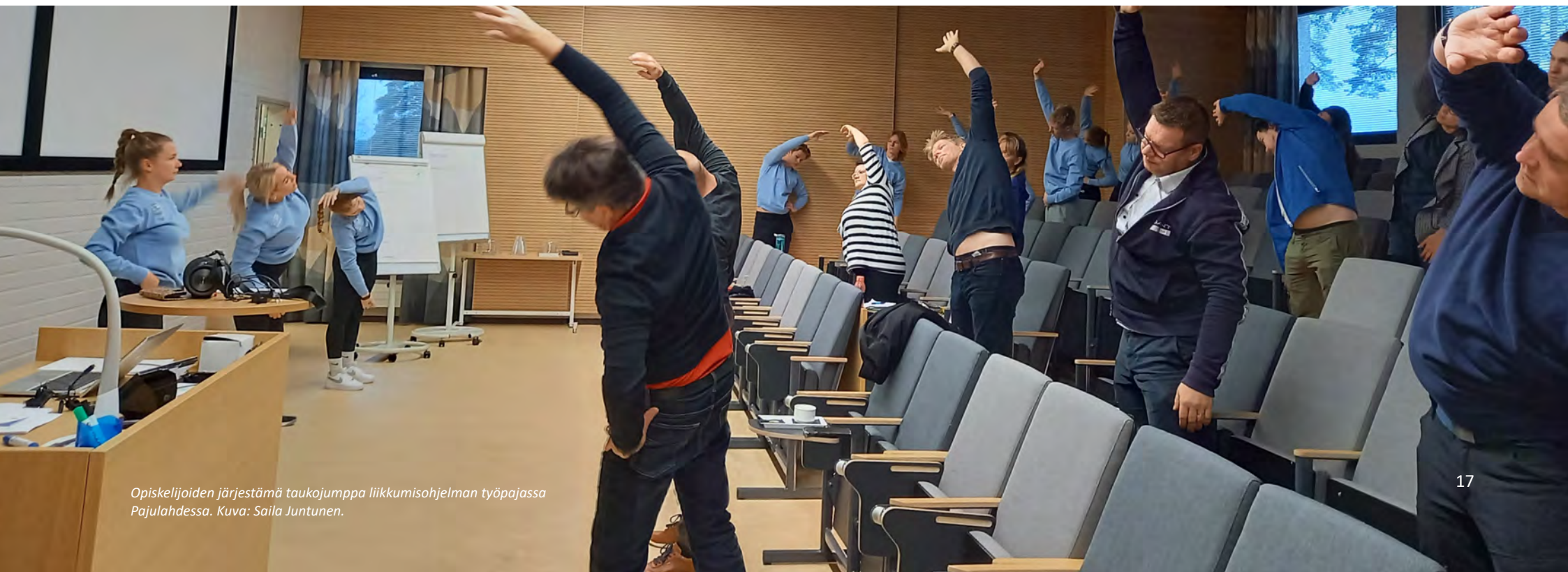
Opiskelijoiden järjestämä taukojumppa liikkumishjelman työpajassa Pajulahdessa.