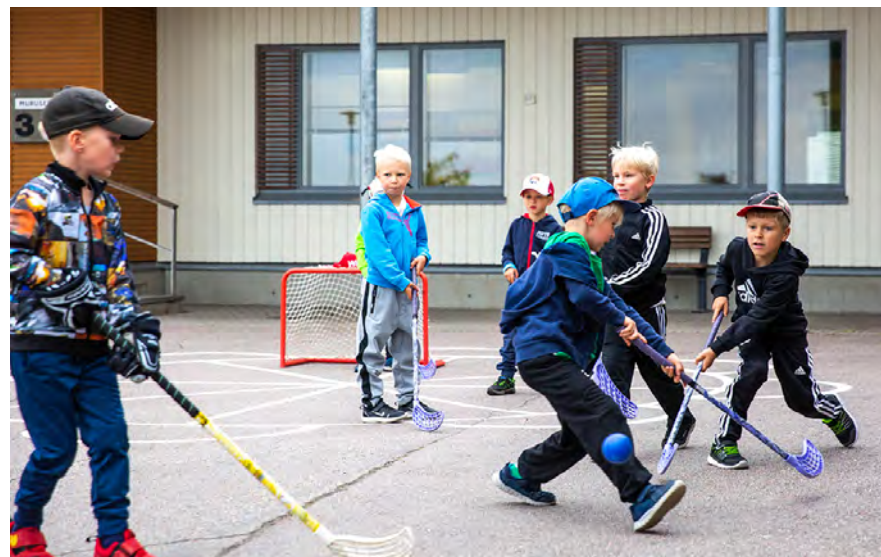
Pihaliikuntaa Renkomäen päiväkodissa.

Päijät-Hämeessä on tehty jo vuosia suunnitelmallista työtä liikunnan edistämiseksi. Päijät-Hämeen ensimmäinen terveysliikuntastrategia laadittiin vuosille 2009–2020. Sport Päijät-Häme strategia laadittiin vuosiksi 2016–2020. Lisäksi Päijät-Hämeessä on laadittu Liikunnan, elämysten ja hyvinvoinnin tiekartta 2030, johon on koottu kokonaisuuteen liittyviä kehittämistoimia. Tämä liikkumishjelma on jatkoa aikaisemmille strategioille. Ohjelma on myös osa Päijät-Hämeen hyvinvointisuunnitelman 2022–2025 toimeenpanoa ja ohjelmalla haetaan vaikutuksia Päijät-Hämeen hyvinvoinnin ja terveyden edistämisen painopistealueisiin eli hyte-kärkiin. Kuluva kauden hyte-kärkiä ovat mielen hyvinvointi, osallisuus ja yhteisöllisyys, arjen turvallisuus sekä päihteettömyys ja terveelliset elintavat.