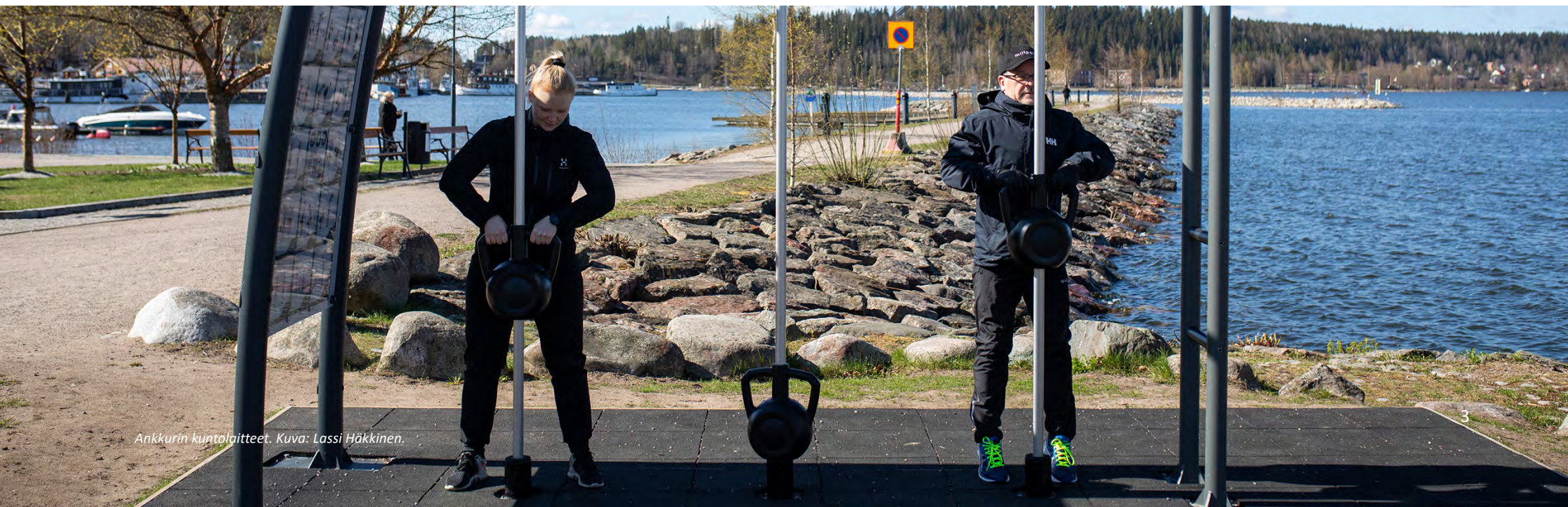
Ankkurin kuntolaitteet.

Saavuttaaksemme ohjelman tavoitteet tarvitaan eri hallinnonalojen ja eri toimijoiden välistä yhteistyötä sekä sitoutumista yhteisiin tavoitteisiin maakunnallisesti sekä kuntien sisällä. Yhteisen työn lisäksi jokainen organisaatio voi poimia ohjelman tavoitteista ja toimenpiteistä itselle sopivimmat ja toteuttaa niitä. Tavoitteena on, että liikkumisohjelma kokoaa yhteen liikkumisen edistämistyötä tekeviä ja se on aktiivisessa käytössä koko Päijät-Hämeessä!